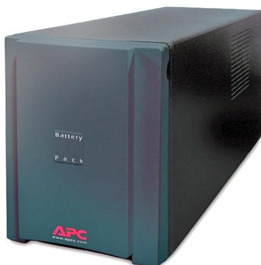
Рисунок 8 – Внешний вид батарейного блока

Внешний вид батарейного блока представлен на рисунке 8.