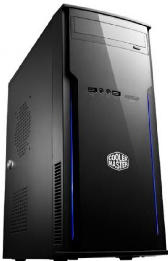
Рисунок 2 – Внешний вид системного блока

Внешний вид системного блока представлен на рисунке 2.