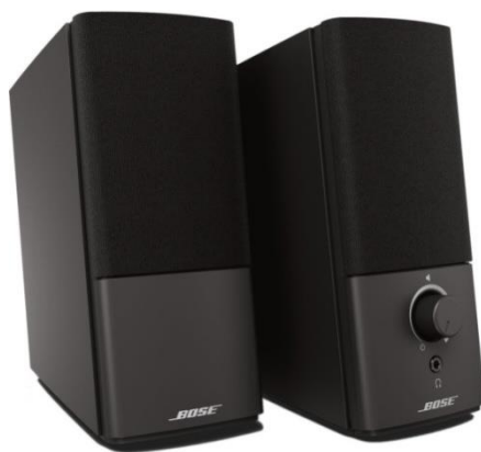
Рисунок 6 – Внешний вид колонок