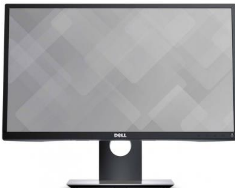
Рисунок 3 – Внешний вид монитора

Внешний вид монитора представлен на рисунке 3.