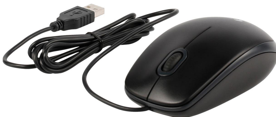
Рисунок 5 – Внешний вид манипулятора «мышь»

Внешний вид манипулятора типа «мышь» представлен на рисунке 5.