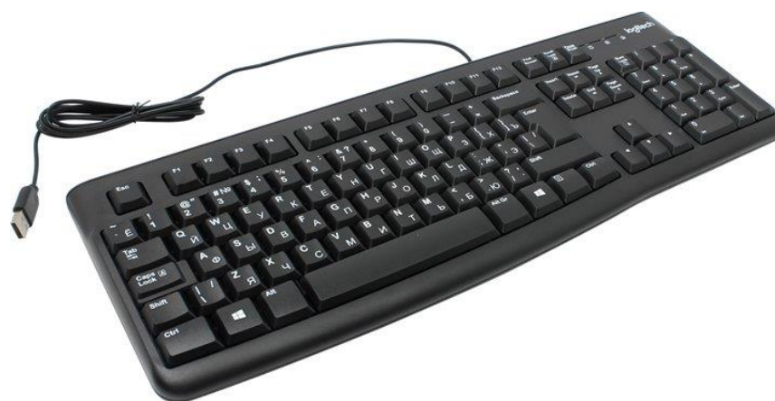
Рисунок 4 – Внешний вид клавиатуры