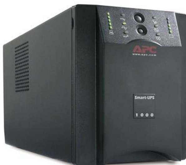
Рисунок 7 – Внешний вид блока бесперебойного питания

Подключение монитора и системного блока к сети электропитания осуществляется через БП. В случае прекращения подачи электропитания от сети БП автоматически переключается в режим электропитания от аккумуляторной батареи. При работе от батареи, БП подает четыре коротких звуковых сигнала каждые 30 секунд.